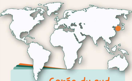
Corée du sud

Bien évidemment, les visites proposées peuvent être sujet à discussion selon l'envie du groupe qui participera à ce voyage extraordinaire.