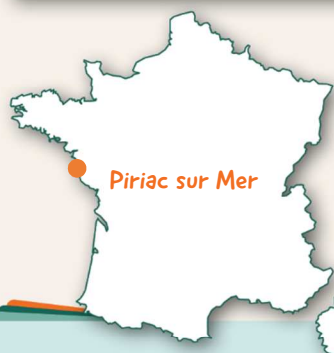
Piriac sur Mer

Pour changer de l'eau salée, deux sorties au centre aquatique intercommunal seront proposées.